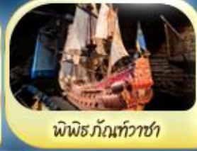
พิพิธภัณฑ์ทิวาชา